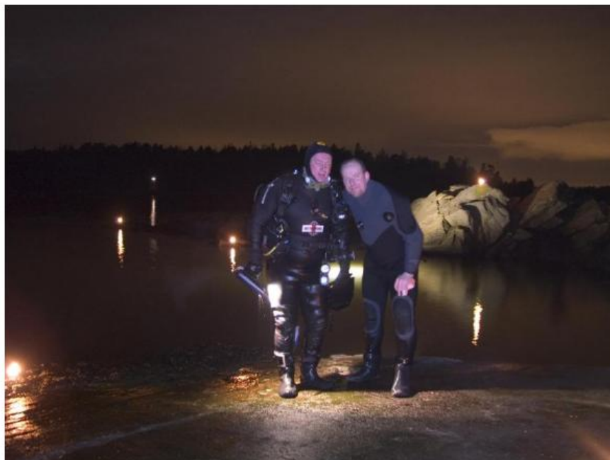
Leder og nestleder på Svelvikstranda under nattdykket i 2005.