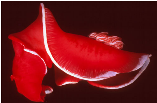
Illustrasjonsbilde. Spanish dancer