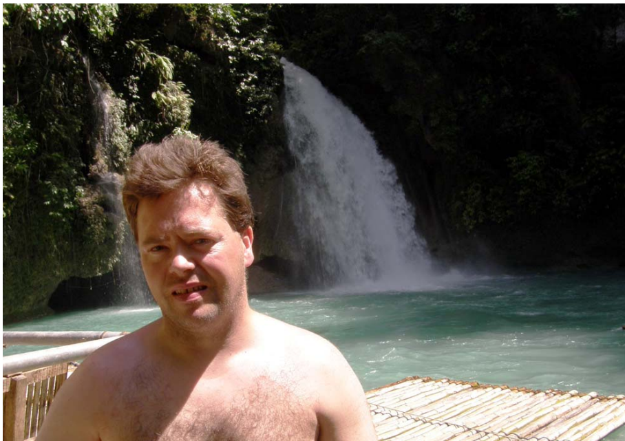
Undertegnede ved Kawasan Falls, Cebu

Besøkte også en annen turistspot: Kawasan Falls utenfor Moalboal. Dette er 2 fosser fra innsjøer. Her kan du bli med på flåtetur og virkelig kjenne trykket fra vannet og hoppe i fossen fra 13 meters høyde.