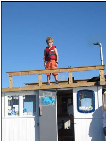
Sjefen på taket for å ha full oversikt over hordene. Regnbuen dukket også fram.

Gummi og Gyda fikk kjørt seg med å droppe dykkere rundt omkring i området. Det ble dykket på og rundt Fjærskjær som kanskje er det beste stedet i området.