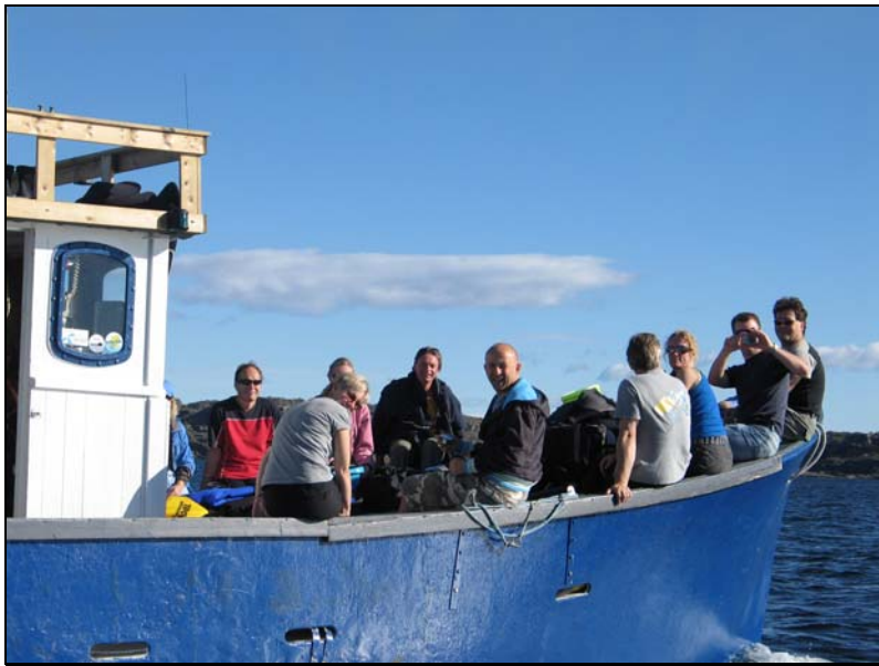
Steinbiten på veg ut mot St. Fjærskjær og en gjeng forventningsfulle dykkere.

Gummi og Gyda fikk kjørt seg med å droppe dykkere rundt omkring i området. Det ble dykket på og rundt Fjærskjær som kanskje er det beste stedet i området.