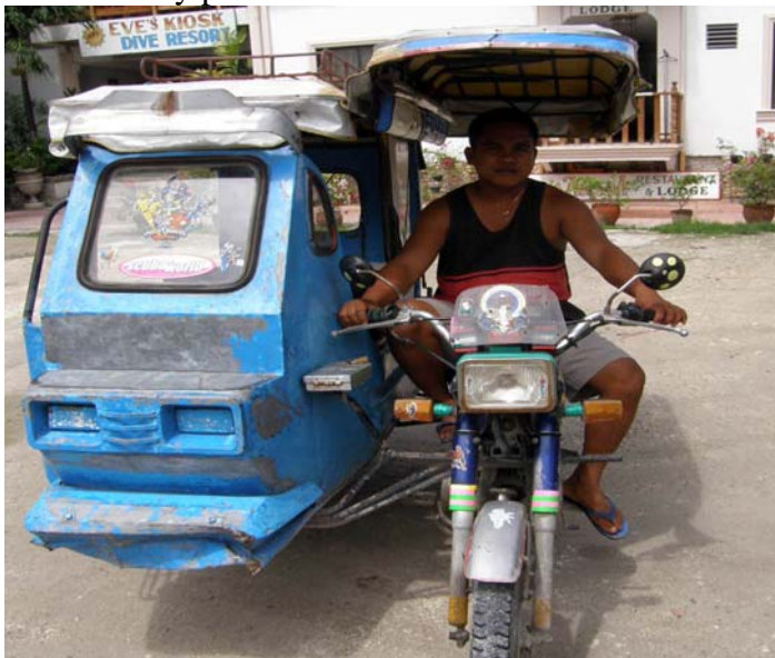
Filippinsk taxi: Tricycle. Her fra Moalboal, Cebu.