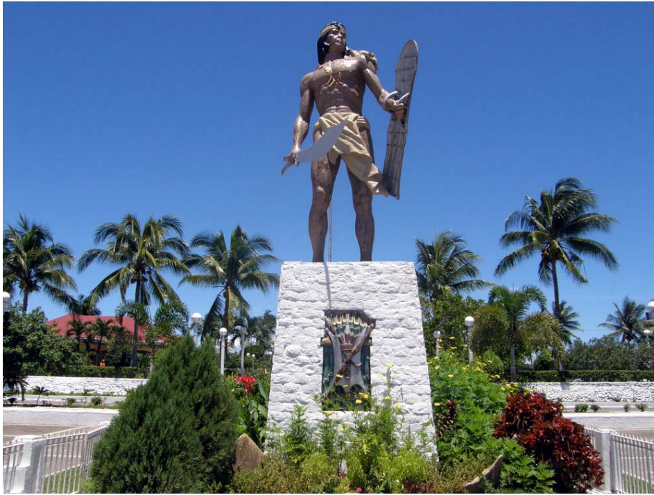
Krigeren Lapu-Lapu som nedkjempet Fernando Magellan i 1521 på Mactan ved Cebu.