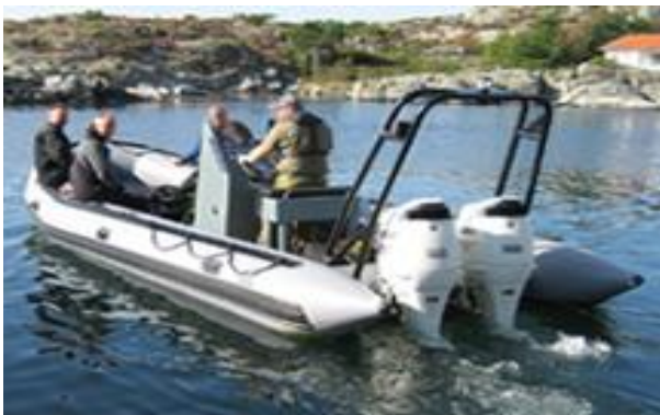
RIB'en til Adykk

NB! Vi må ha bindende påmelding innen søndag 9. mars til: tonsbergdykk@gmail.com