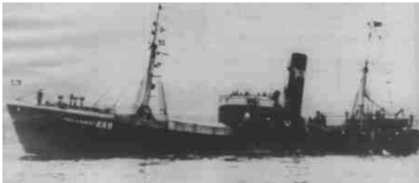
M1101. Dette bildet fikk jeg fra en historisk site i Tvskland.

← Her nedenfor finnes link til historien om M1101 som ligger ved Hellene syd for Verdens Ende på Tjøme og som vi har beskrevet dykking på i denne Blekka: http://www.skovheim.org/m11012.htm >. Hilsen Dag Deberitz.