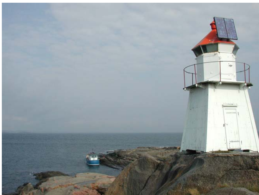
Foto av M/S Steinbiten på "Dag's marked",- eller nord-odden av Store Færder på Tjømetreffens andre dykkerdag. Her har vi vært utallige ganger! Stedet rangeres som et av de beste dykker-stedene i Ytre Oslo-fjord. "Pyramiden" ligger ca. 50 meter foran båten, litt mot høyre.

Granater ligger som regel ikke oppe i dagen, med husk de er der!.