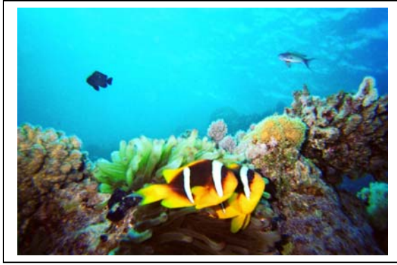
Klovnefisk: Tosomhet er best på revet!