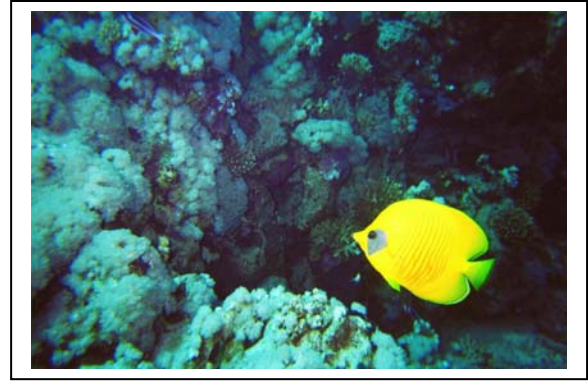
En Lemon Butterflyfish gjør seg til.

Strømmen var sånn passe. Dvs. at du stort sett korrigerer stillingen og seg sakte av gårde.