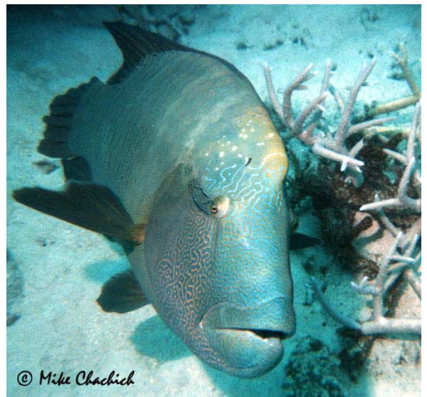
Typisk Napoleonfisk.

En stooooor Napoleon-fisk søkte kontakt med oss flere ganger gjennom driftet. En container som hadde blåst av et fartøy huset nå en mengde fisk, - litt bekymret for at noe skulle kunne bite hue av meg kikket vi in i denne. Jaggu var ikke napoleonfiskene inni her også. Blue Spotted Stingray og murener var et vanlig syn her og som dykkere begynte vi å bli blaserte av den slags. Her kom jeg faktisk over en blekk-sprut, slik de ser ut i Donald-blader. Kjempe-stilig, men også lynrask til å trække hele kroppen sin inn i en utrolig liten sprekk. Oppe ventet middagen mens solen sank i rødehavet og ga oss et gnistrende farvel. Etter en avtemning om bord kjørte båten oss til kai så vi fikk en natt på hotellet i stedet for å sove i båten og legge til kai først til frokost. Oppglødde, - men sliiiitne satt vi i bussen, ble satt av foran hotellet og slepte utstyret opp alle trappene før vi stupte i seng.