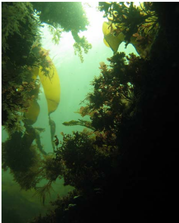
Naturmotiv fra Gloskjær

Påskeaften og 1. Påskedag var det vår eminente Leder Dag som også fant ut at Gloskjær var stedet å velge.