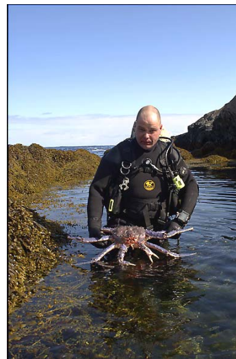
Til venstre: "Konge- krabbehår." Til høyre en meget skjelden gjest: Blue Kingcrab.